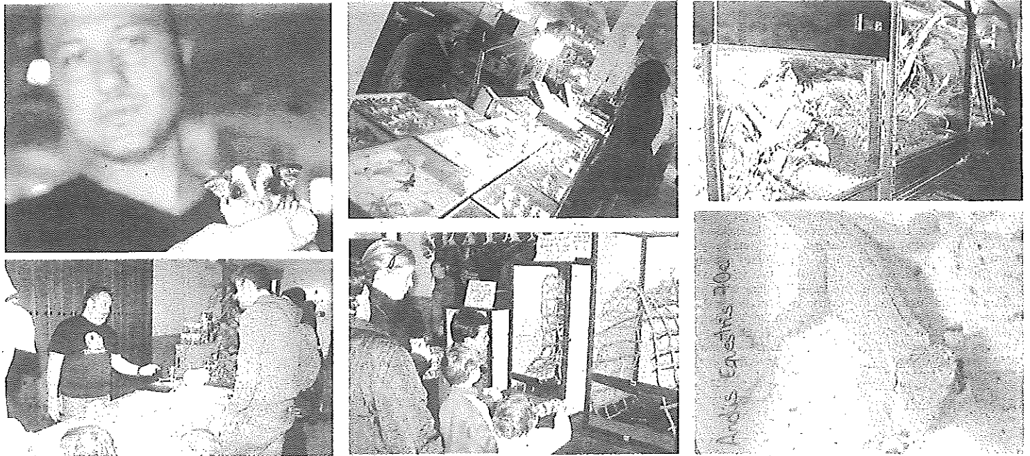
La segunda edición de Terrasur acogió un importante número de especies repartidos en más de 70 puestos diferentes. Cerca de mil personas vieron de cerca a estos particulares animales de compañía. DAVID SIERRAS

UBICACIÓN El Hotel Convento La Magdalena acogió este encuentro de animales exóticos a nivel andaluz